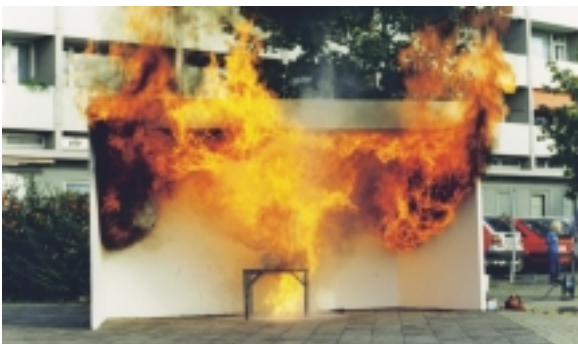
Abb. 7-14: Schon ein Schnapsglas voll Wasser genügt, um einen Topf mit brennendem Fett zur Explosion zu bringen. Diese Bilder entstanden innerhalb von nur drei Sekunden!