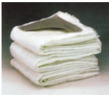
Abb. 6: Feuerlöschdecken

Mit Hilfe der aus feuerfestem Material (z.B. Glasfaser oder Aramid-Nadelfilz) bestehenden Löschdecken können besonders kleine Brände erstickt werden. Der brennende Gegenstand wird mit der Decke abgedeckt oder eingewickelt, so dass die Flammen aus Sauerstoffmangel verlöschen; dabei ist darauf zu achten, dass die Löschdecke nicht zu früh von der Brandstelle weggenommen wird, da ein Wiedererzünden sonst möglich ist. Zum Ablöschen von