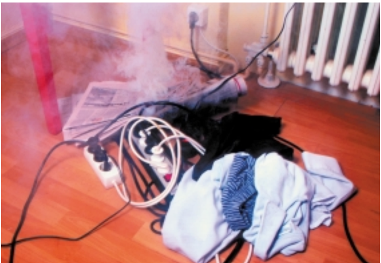
Abb. 1: Beispiel für die Folgen einer überlasteten Stromleitung