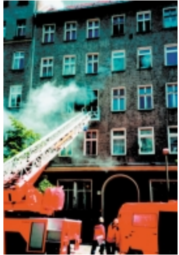
Abb. 15: Wenn die Fluchtwege nicht benutzbar sind, rettet die Feuerwehr eingeschlossene Personen mit Leitern

dadurch neuen Sauerstoff bekommt. Es könnte eine Durchzündung stattfinden, wobei eine Stichflamme aus der Tür schlagen kann. Wählen Sie nach Möglichkeit ein Zimmer, aus dem Sie sich selbst in Sicherheit bringen können (z.B. auf ein Flachdach, in den Garten, auf einen Nachbarbalkon, etc.). Wenn dies nicht möglich ist, wählen Sie ein Zimmer mit Fenstern, die die Feuerwehr leicht mit ihren Leitern erreichen kann. Verstopfen Sie die Spalten in der Tür mit Textilien, Klebeband, etc., damit kein Rauch eindringen kann. Rufen Sie die Feuerwehr oder machen Sie sich am offenen Fenster bemerkbar. Springen Sie auf keinen Fall aus höher gelegenen Fenstern! Die Fenster einer Wohnung sind in vielen Fällen vom Architekten als Fluchtweg vorgesehen worden. Die Feuerwehr ist dafür ausgebildet, Personen auch über Fenster sicher zu retten. Bleiben Sie ruhig und befolgen Sie die Anweisungen der Feuerwehr.