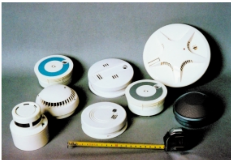
Abb. 3: Verschiedene VdS-geprüfte Rauchmelder

Um die Funktion zu garantieren, muss sichergestellt werden, dass die Batterie noch ausreichend stark ist. VdS-zertifizierte Rauchmelder geben bei schwächer werdender Batterie über einen Zeitraum von mindestens 30 Tagen einen Warnton von sich. Die Geräte haben des weiteren einen Testknopf, mit dem in regelmäßigen Abständen die Funktionstüchtigkeit geprüft werden sollte.