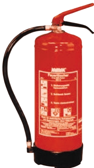
Abb. 5: Handelsüblicher Schaumlöscher

Mit einem Feuerlöscher können Entstehungsbrände (also kleine Feuer zu Beginn eines Brandes) effektiv bekämpft werden. Ein Feuerlöscher ist ab etwa 50 € erhältlich; die alle zwei Jahre notwendige Wartung kostet zwischen 30 € und 60 €.